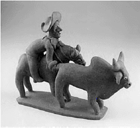
Mestre Vitalino. Vaquejada , 1961. Cerâmica policromada. 27,5 x 9 x 22 cm. Museu do Homem do Nordeste (Recife, PE).

Tomando como referência a figura e os conhecimentos sobre arte e cultura, considere as afirmativas a seguir.