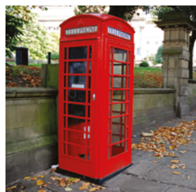
Cabina telefónica / Locutorio