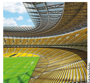
Estadio / Gimnasio