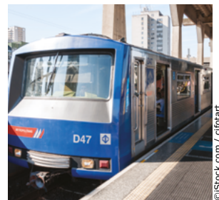
Estación de metro