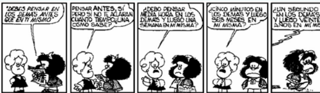
QUINO. Toda Mafalda . 1996.

La expresión “pero”, en la segunda viñeta, establece una relación de