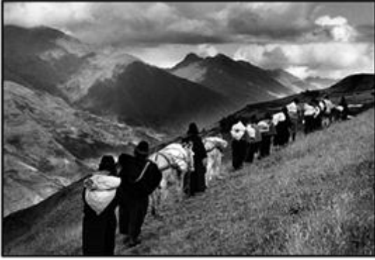
Fotografia de Sebastião Salgado, no Projeto Outras Américas (1977-1983).