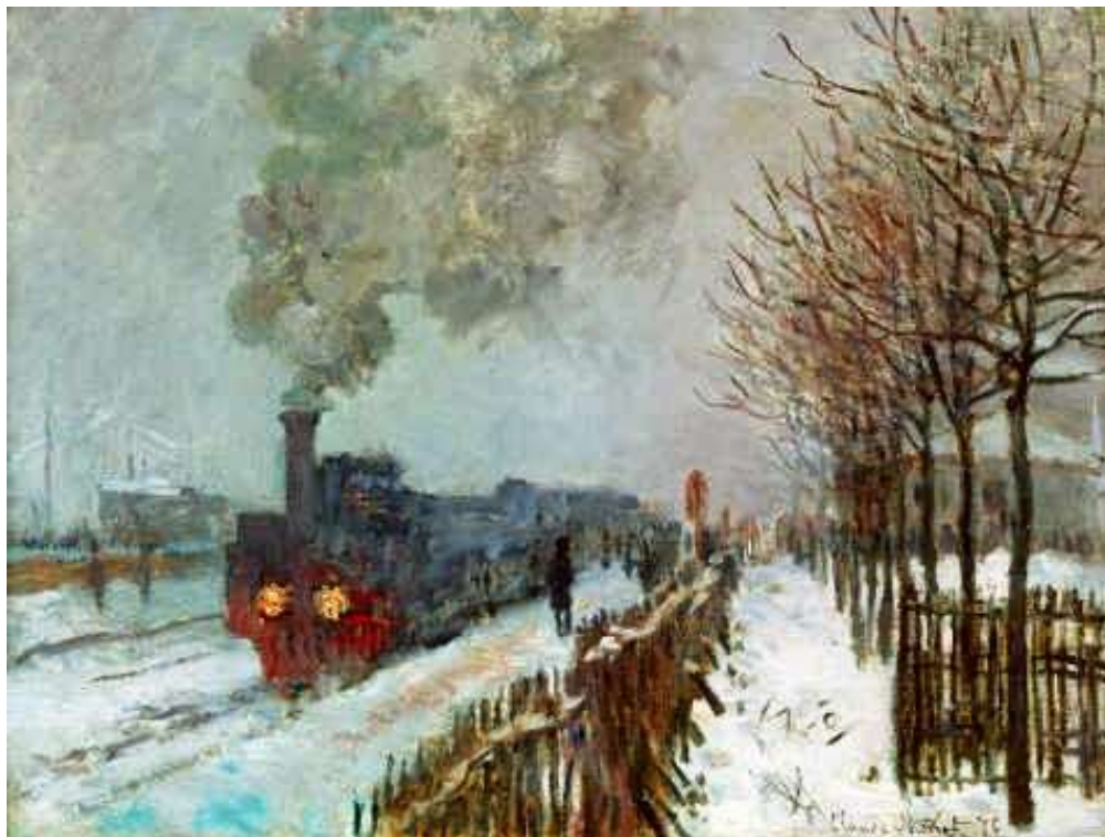
Monet - Le train dans la neige , 1875.

5. (UEL) Com base na figura abaixo, e nos conhecimentos sobre o Impressionismo, considere as afirmativas a seguir: