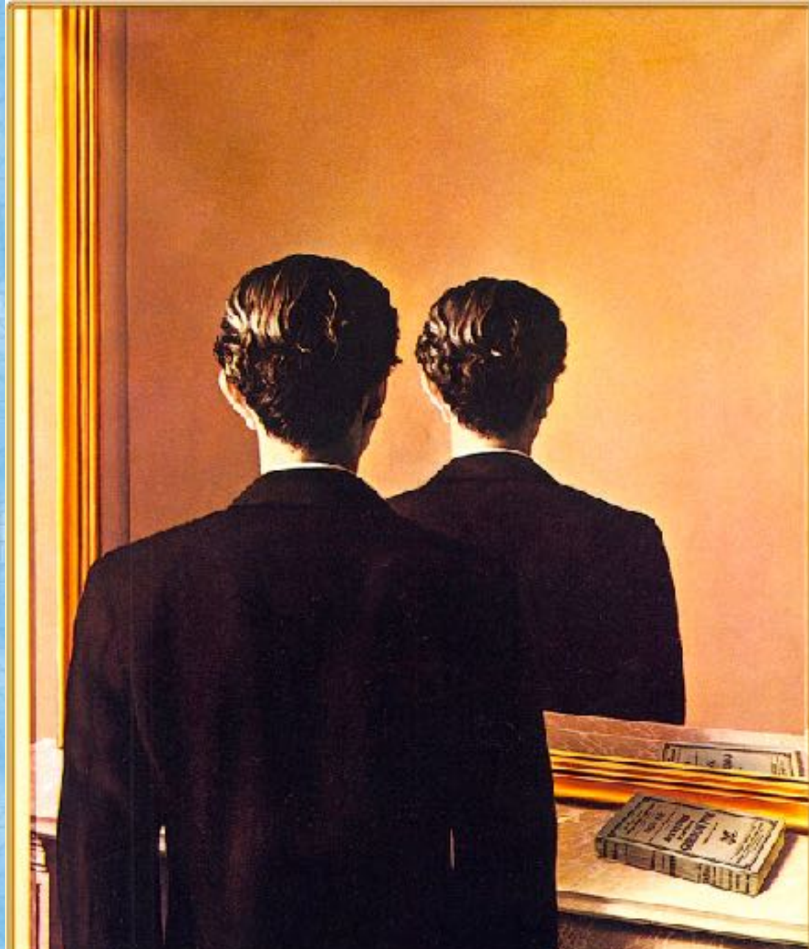
MAGRITTE, R. A reprodução proibida. Óleo sobre tela, 81,3 x 65 cm. Museum Boijmans van Beuningen, Holanda, 1937.