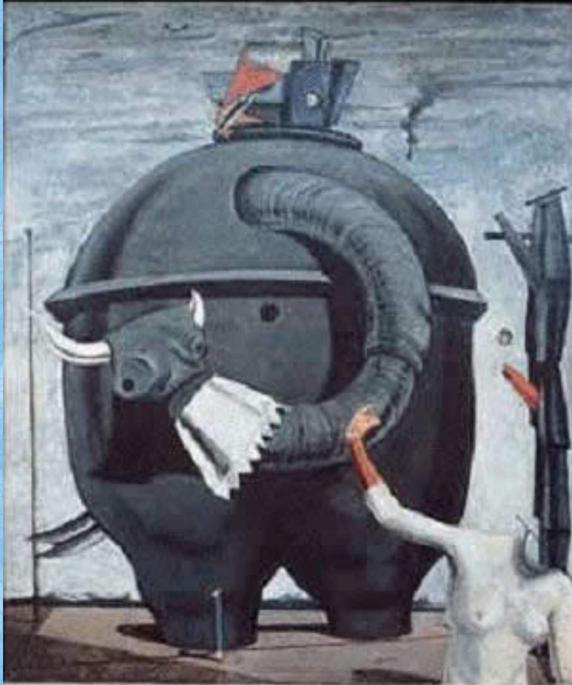
RNEST, M. O gigante acéfalo . Disponível em: www.historiadaarte.com.br .