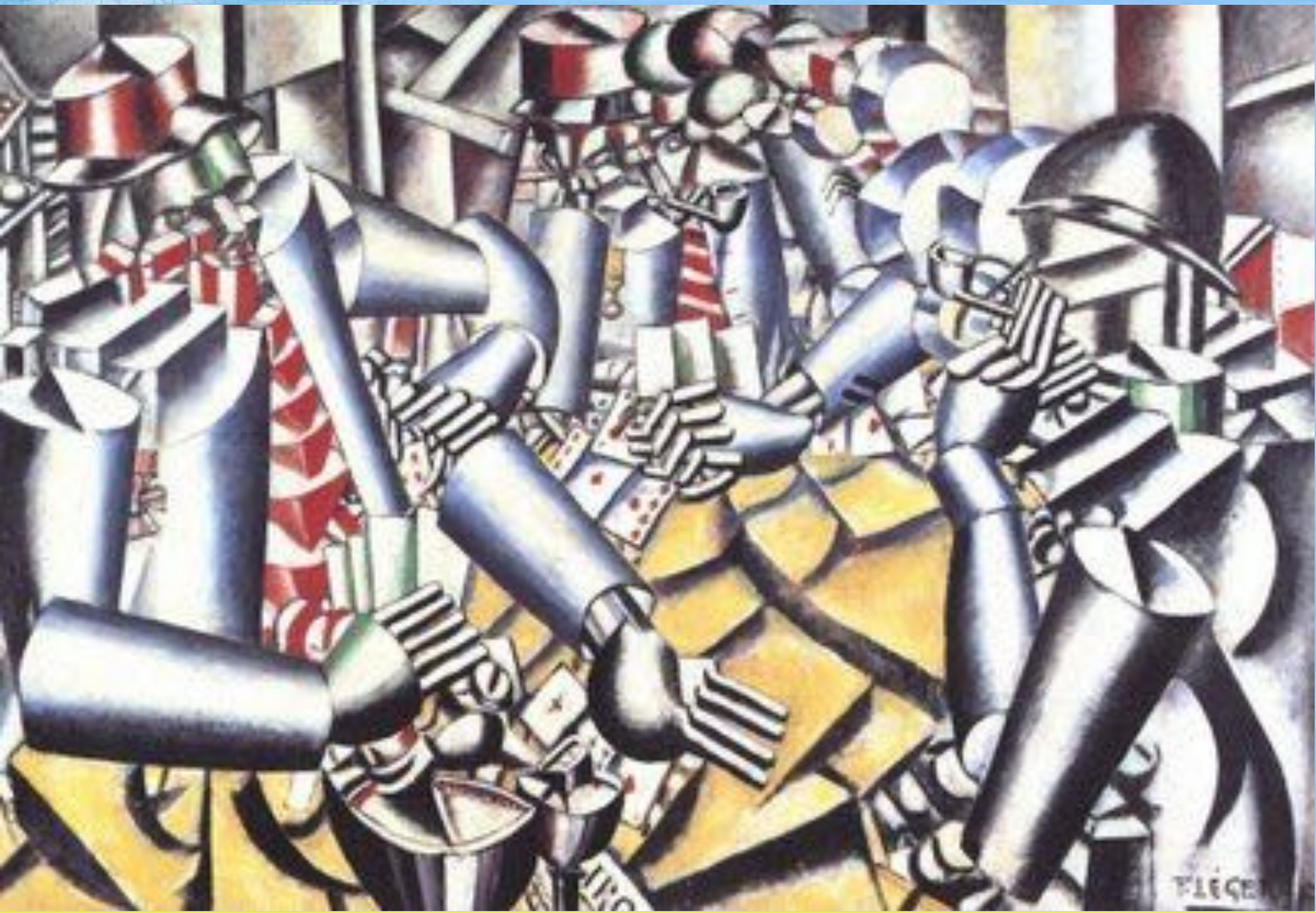
FERNAND LÉGER. Soldados jogando cartas. 1917.