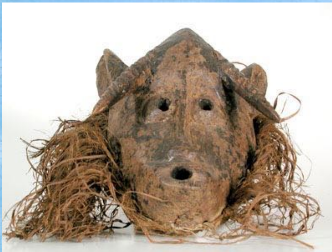
Máscara senufo. Mali. Madeira e fibra vegetal. Acervo do MAE/USP.