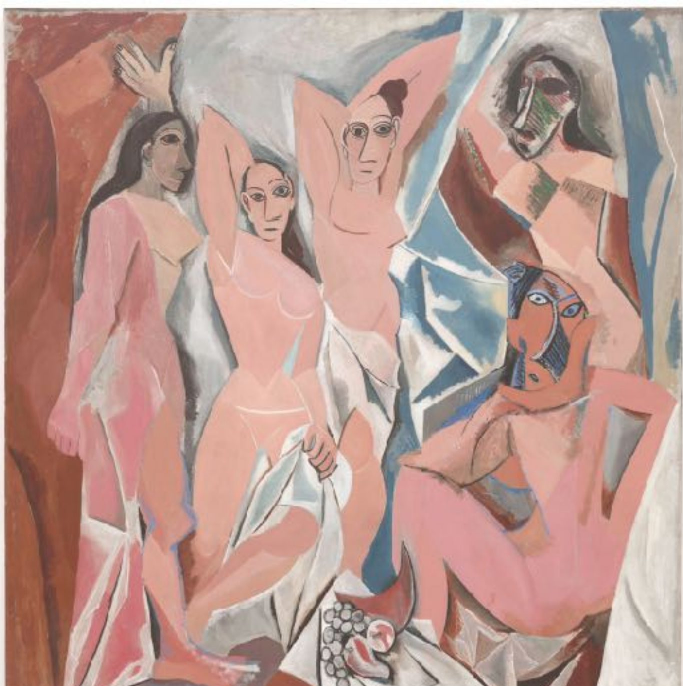
PABLO PICASSO. Les demoiselles d'Avignon. No manoelneves.com