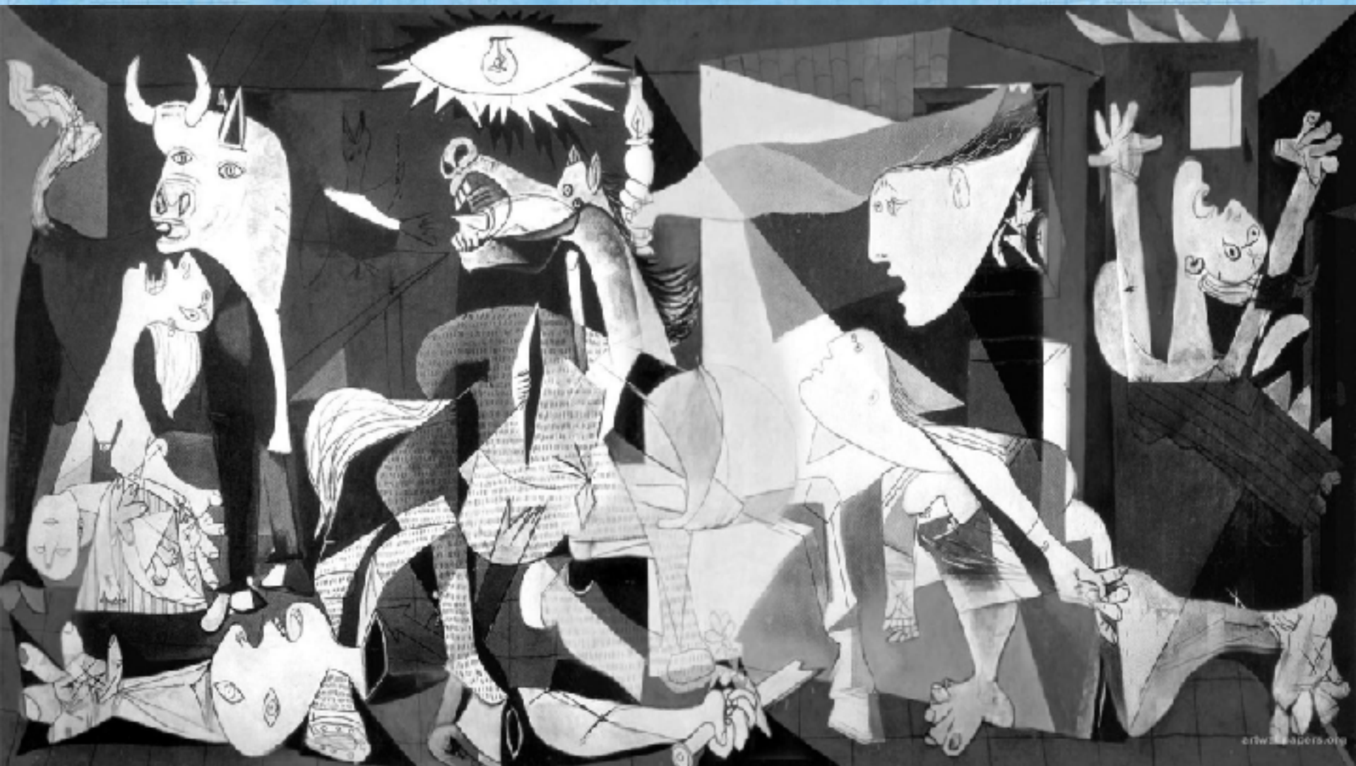
PICASSO, Pablo. Guernica.