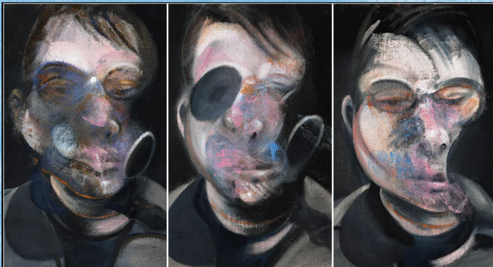
BACON, F. Três estudos para um autorretrato . Óleo sobre tela, 37,5 x 31,8 cm (cada), 1974. Disponível em: www.metmuseum.org . Acesso em: 30 maio 2016.