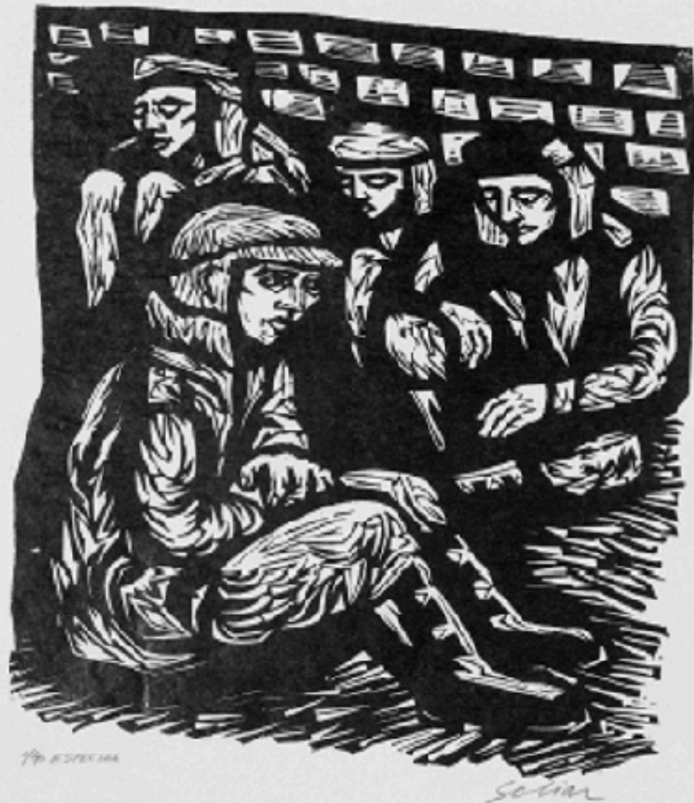
SCLIAR, Carlos. Soldados no front . Xilografia s/ papel, 32,7 x 21,9. Disponível em: http://www.mac.usp.br/mac/mer manoeineves.com