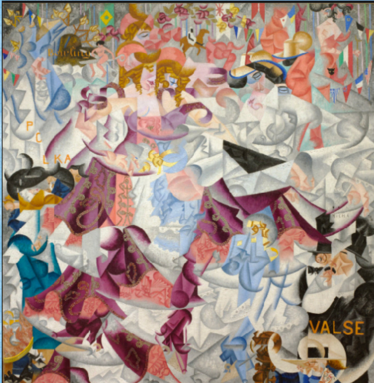
SEVERINI, G. A hieroglífica dinâmica do Mal Tabarin . Óleo sobre tela, 161,6 x 156,2 cm. Museu de Arte Moderna, Nova Iorque, 1912. Disponível em: www.moma.org . Acesso em: 18 mai. 2013.