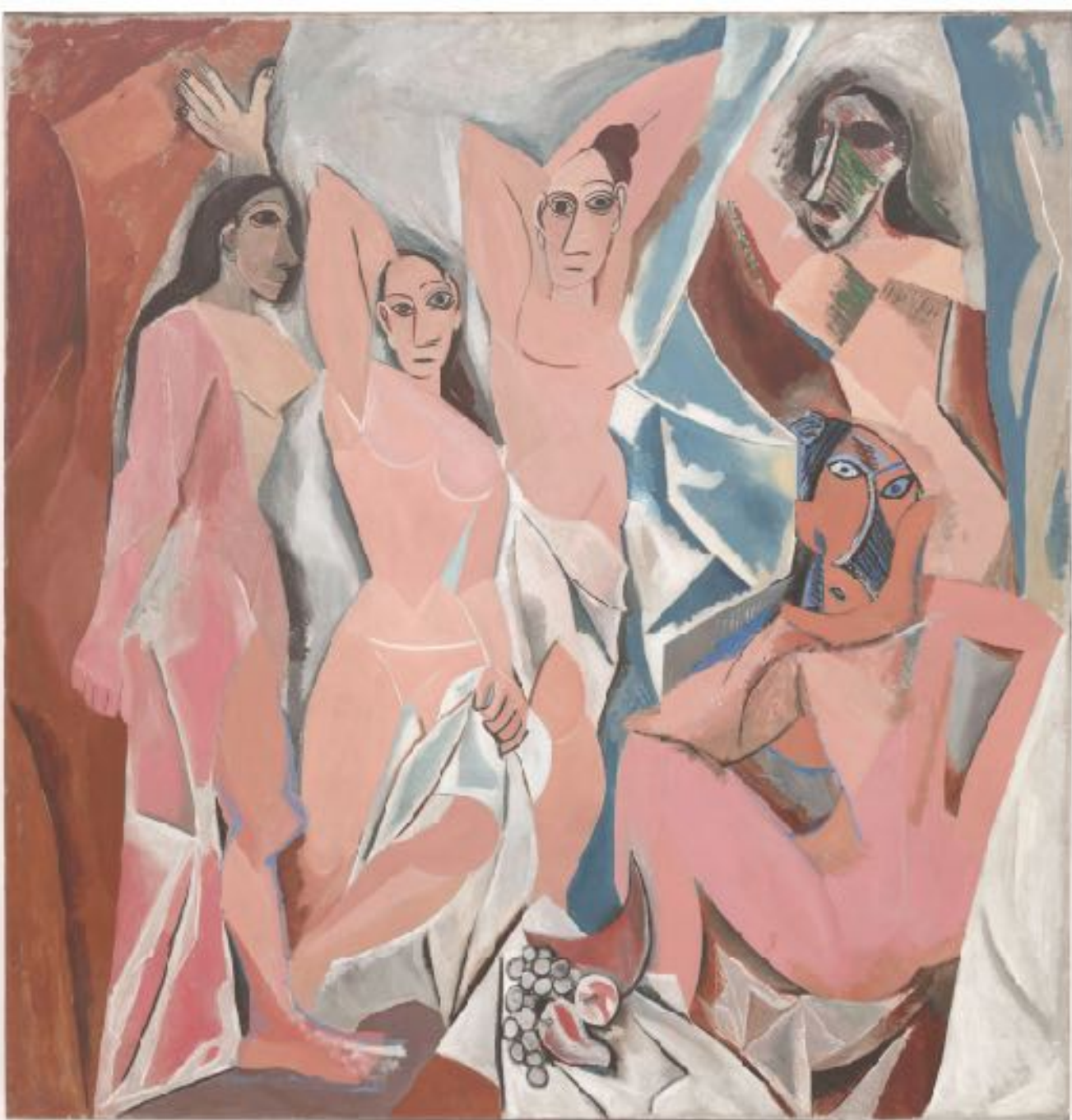
PABLO PICASSO. Les demoiselles d'Avignon . Nova York, 1907.