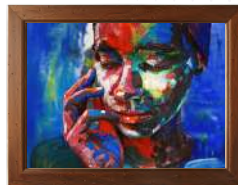
Arte (em todas as suas formas)