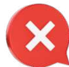
Negação de um clichê

Seja qual for o repertório sociocultural posto no texto, ele deve ser, sempre: