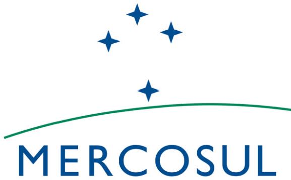
Bandeira do Mercosul