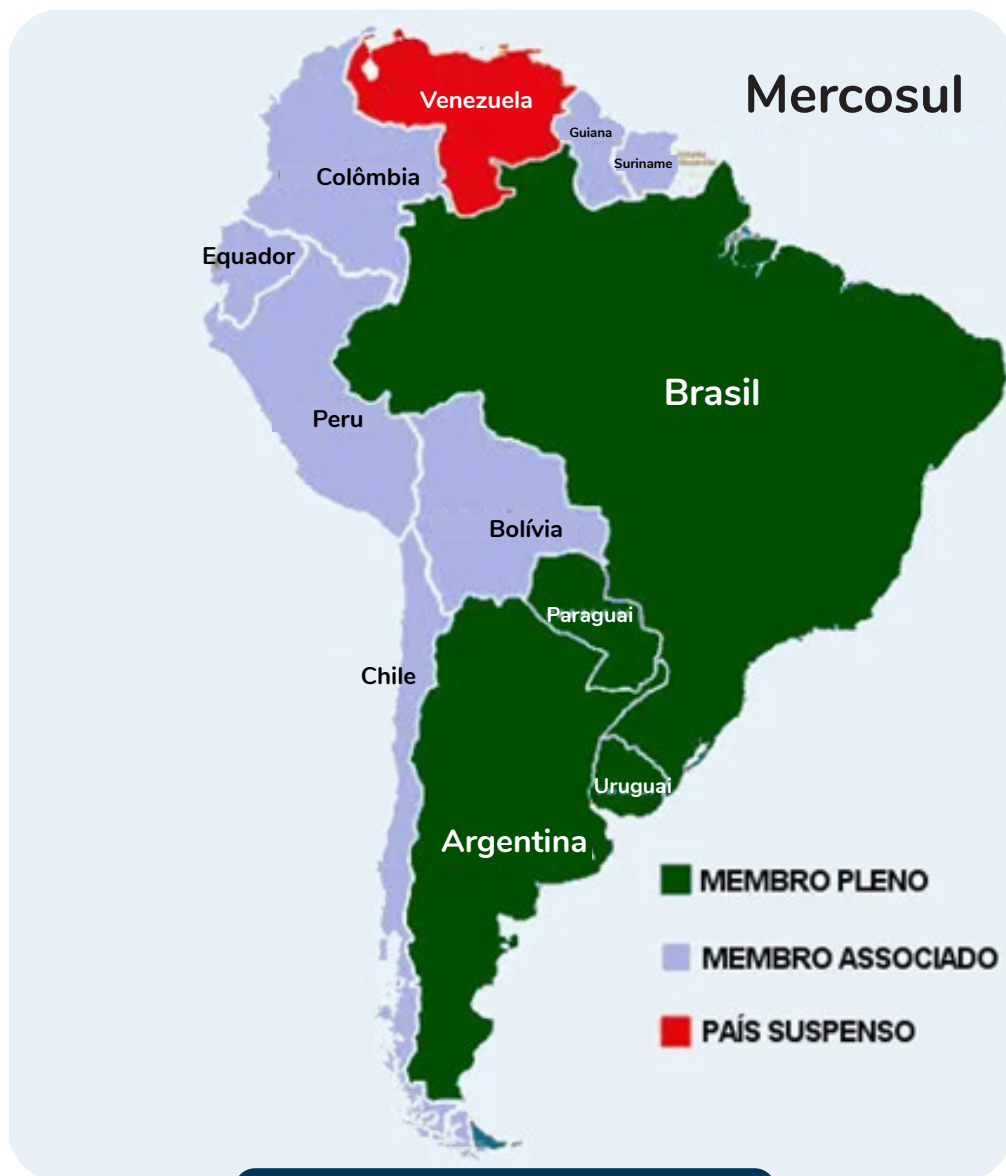
Mapa da América do Sul com destaque para o Mercosul

Os membros plenos do Mercosul incluem as duas maiores economias do continente – Brasil e Argentina –, assim como dois integrantes de menor dimensão, mas de igual importância: Uruguai e Paraguai. A Venezuela está suspensa do Mercosul desde 2016, depois de ter sido admitida em 2012.