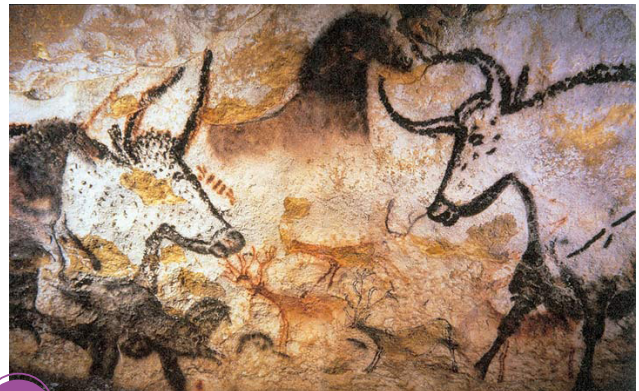
Arte rupestre na Caverna de Lascaux, França