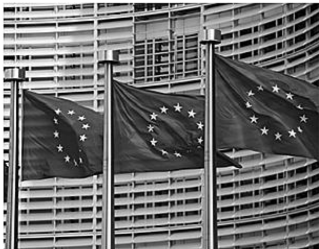
Foto em Bruxelas, 2010.

A disposição circular na bandeira representa a harmonia. O número de estrelas representa o número de países na época de criação da organização.