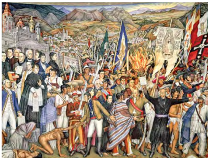
Juan O'Gorman, Retábulo da Independência , pintura mural, 1960-1961 (detalhe).

A imagem acima é representativa do movimento muralista mexicano, que, entre outras características, explorou temas da História do México. Nesse detalhe, é possível identificar a