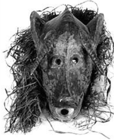
Máscara senofo , Mali. Madeira e fibra vegetal. Acervo do MAE/USP.

As formas plásticas nas produções africanas conduziram artistas modernos do início do século XX, como Pablo Picasso, a algumas proposições artísticas denominadas vanguardas. A máscara remete à