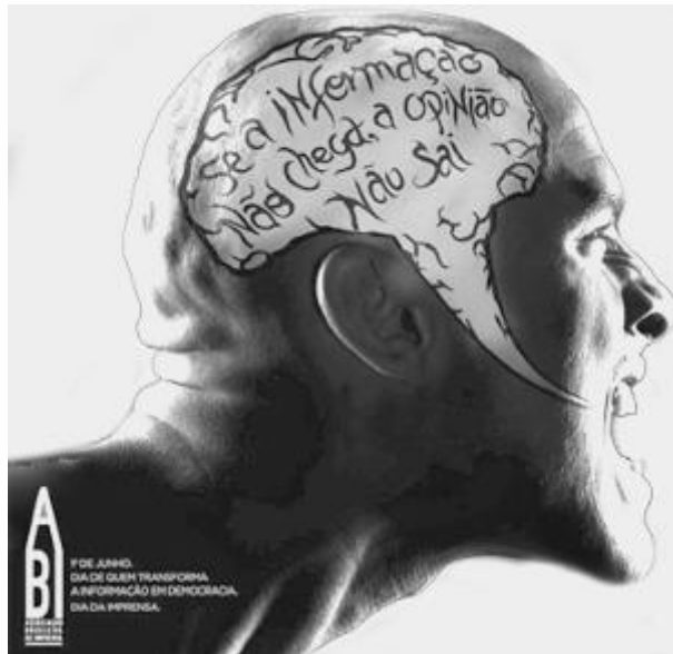
Zero Hora, jun. 2008 (adaptado).

Dia do Músico, do Professor, da Secretária, do Veterinário... Muitas são as datas comemoradas ao longo do ano e elas, ao darem visibilidade a segmentos específicos da sociedade, oportunizam uma reflexão sobre a responsabilidade social desses segmentos. Nesse contexto, está inserida a propaganda da Associação Brasileira de Imprensa (ABI), em que se combinam elementos verbais e não verbais para se abordar a estreita relação entre imprensa, cidadania, informação e opinião. Sobre essa relação, depreende-se do texto da ABI que,