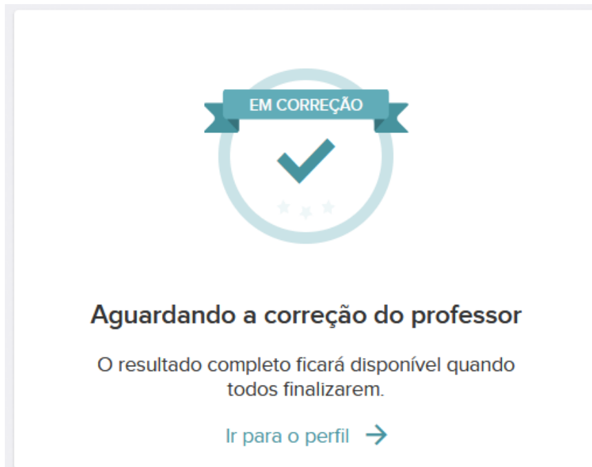
Figura 6: confirmação de envio para correção

Ao clicar em “Enviar”, uma mensagem de confirmação aparecerá para você (figura 6), informando que seu simulado foi encaminhado para nossa equipe de correção. Uma vez enviado, não será possível realizar alterações no formulário ou o upload de novos arquivos.