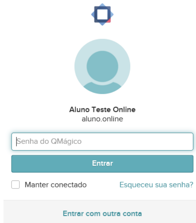
Figura 3: Senha