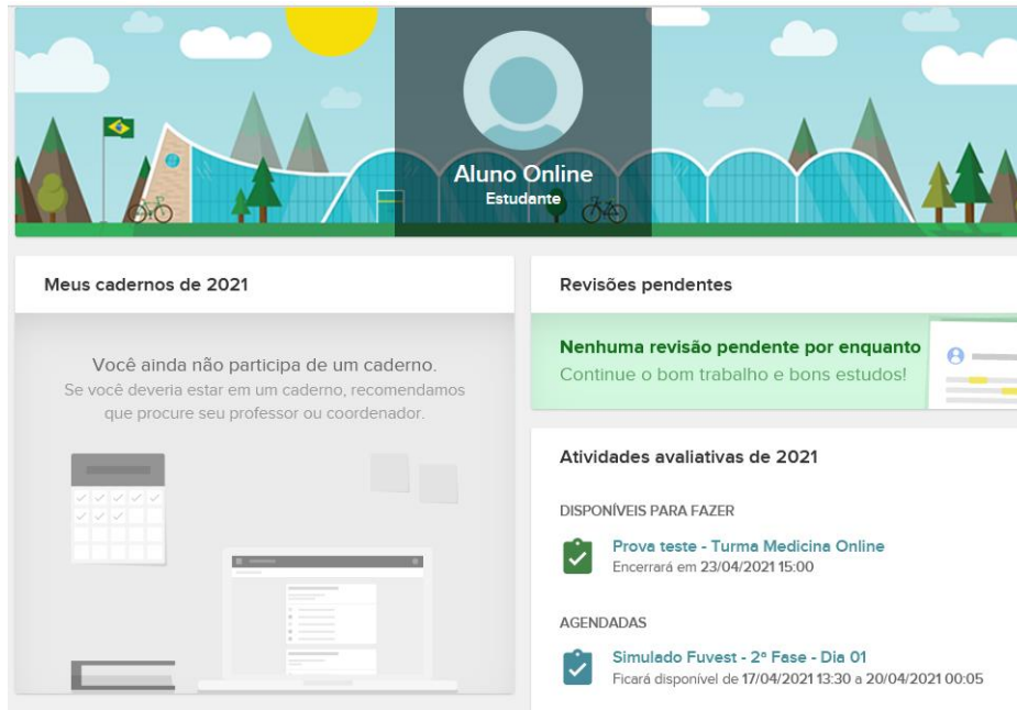
Figura 4: Atividades avaliativas

Clique sobre a prova que deseja realizar. Você será direcionado para tela de início da prova selecionada. Leia as instruções atentamente e clique em “Iniciar” como mostrado na figura 5.