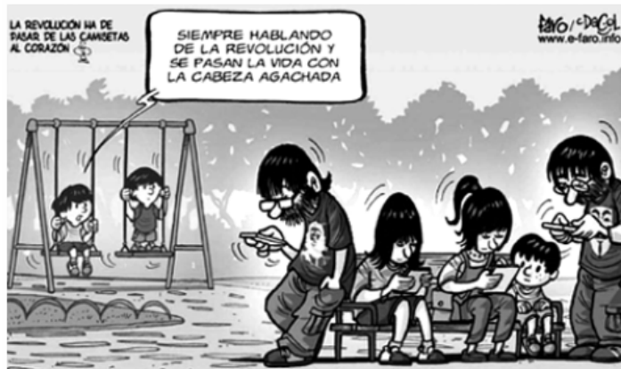
(Disponível em: < http://www.e-faro.info/imagenes/CHISTES/WChmes02/Acudits2015/150713-FB-columpio-nenes-moviles-ipad-whatsapp-adiccion-movil-tablet-padres-revolucion.jpg >. Acesso em: 22 jul. 2016.)

(Uel 2017) Com base na charge, assinale a alternativa que explica, corretamente, o trecho “se pasan la vida con la cabeza agachada”.