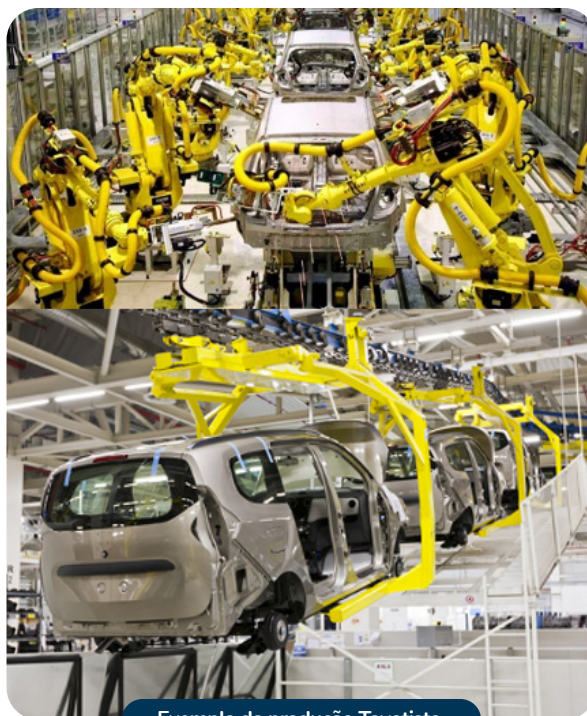
Exemplo da produção Toyotista

Principalmente a partir da década de 1980, a China inicia um processo avassalador de industrialização e de urbanização, notadamente com o programa das Quatro Modernizações de Deng Xiaoping (1979-1989).