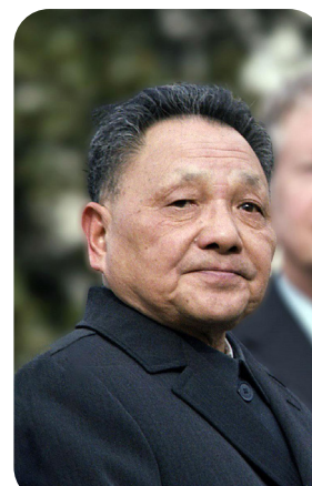
Deng Xiaoping (1904 - 1997)

Os integrantes desse grupo são: Indonésia, Malásia, Filipinas, Vietnã e Tailândia.