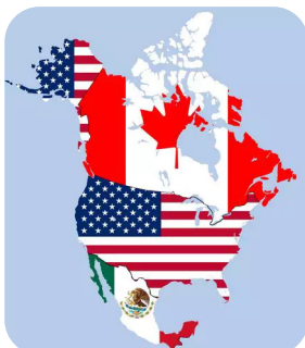
Mapa da América do Norte com destaque para a USMCA

O USMCA é referenciado como um “NAFTA 2.0”, algumas regras foram alteradas para favorecer o protecionismo estadunidense, mas os objetivos principais se mantiveram os mesmos: