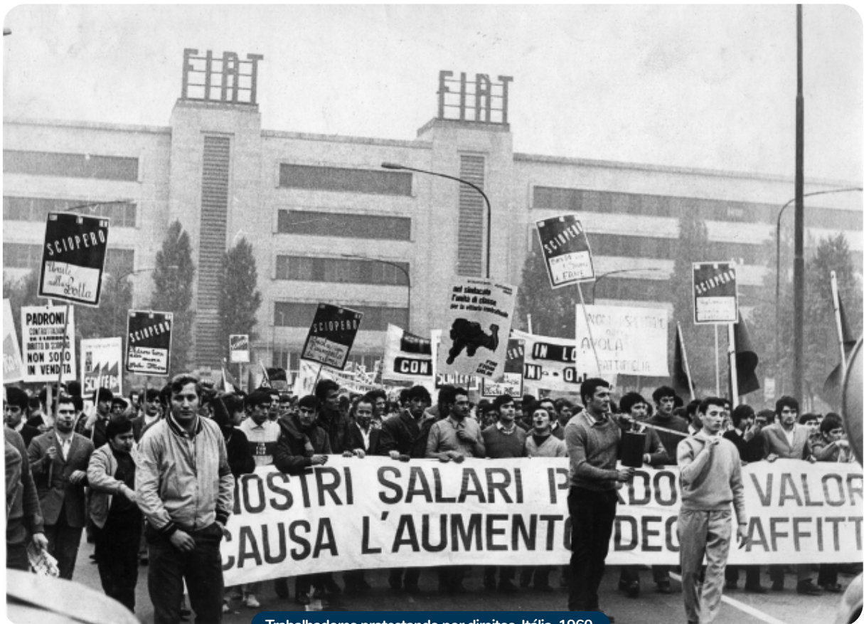
Trabalhadores protestando por direitos, Itália, 1960

Dentre as causas da crise do fordismo estão os choques do petróleo (1973 e 1979) e a busca por modernização tecnológica das empresas.