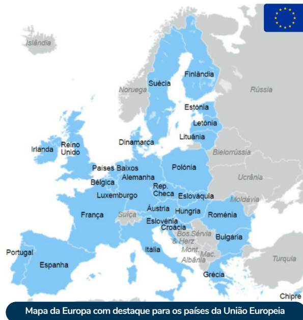
Mapa da Europa com destaque para os países da União Europeia

Sua fundação se deu em 1991, através do Tratado de Assunção, os membros fundadores foram Argentina, Brasil, Uruguai e Paraguai, a Venezuela aderiu em 2005, mas foi suspensa em 2016, por conta dos ataques internos à democracia no país. Pode ser considerado uma União Aduaneira, pois seus países têm uma Tarifa Externa Comum (TEC) com os países de fora do bloco.