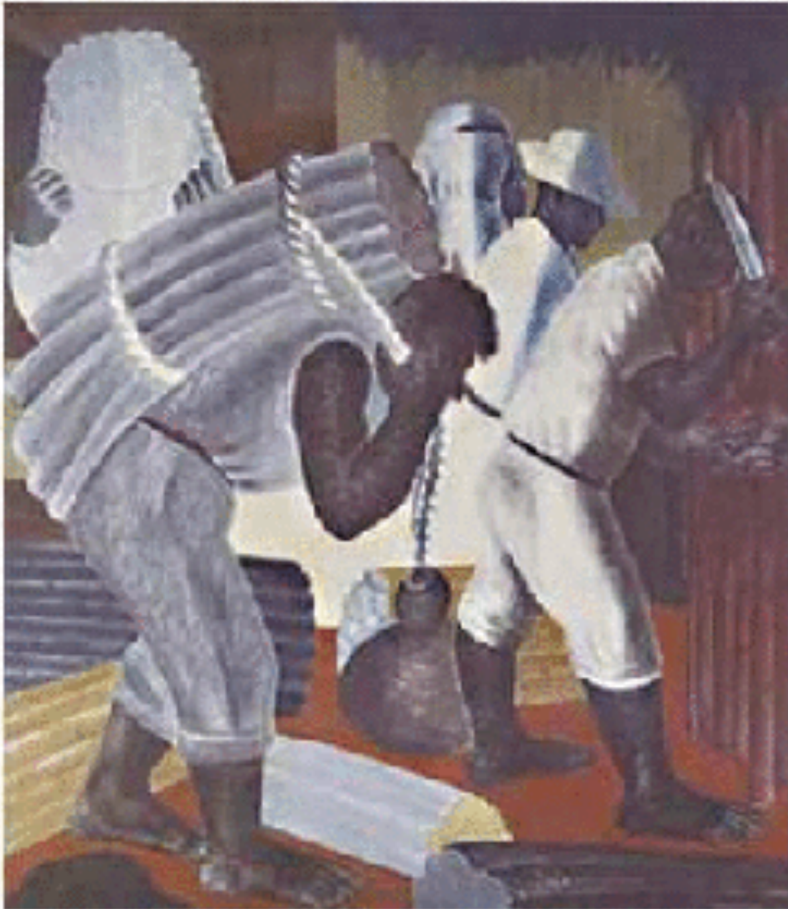
(Cândido Portinari. "Cana". http://enciclopedia.itaucultural.org.br )

Observe o afresco de Cândido Portinari, pintado em 1938 para compor o mural do Ministério da Educação no Rio de Janeiro sobre os ciclos econômicos do Brasil.