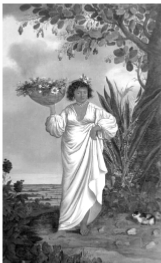
"Mulher Mameluca", ( Mameluca , 1641), óleo sobre tela do pintor dinamarquês Albert Eckhout. Museu Nacional da Dinamarca (Nationalmuseet).

1. (Upe-ssa 1 2018) Observe o quadro a seguir: