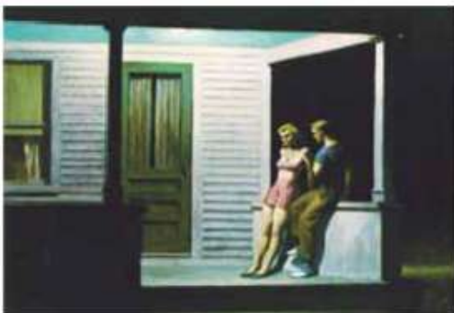
(Edward Hopper. Noite de verão , 1947.)