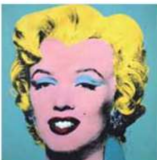
(Andy Warhol. Marilyn , 1964.)