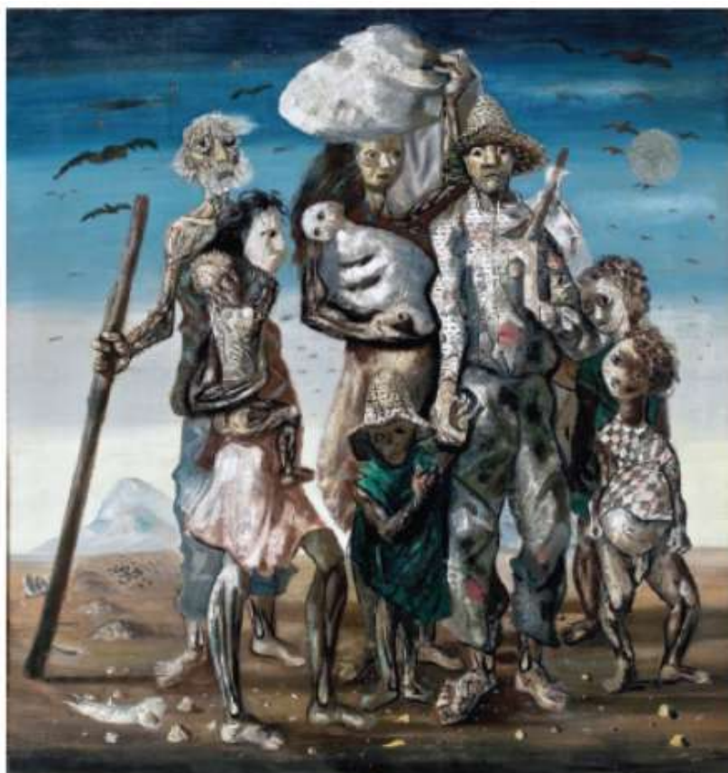
Cândido Portinari. "Os retirantes" (1944). In: Marília Balbi. Portinari: pintor do Brasil . São Paulo: Boitempo, 2003, p. 142.

Identifique a alternativa mais adequada para expressar as relações entre arte e sociedade no quadro: