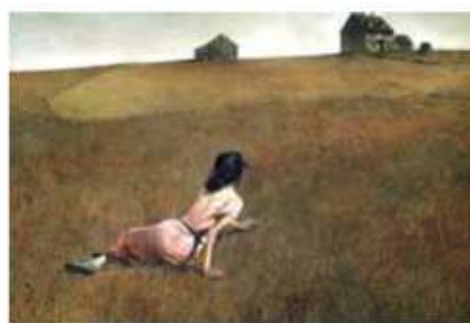
(Andrew Wyeth. O mundo de Christina , 1948.)