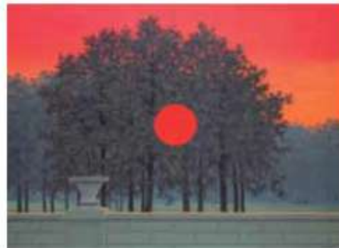
(René Magritte. O banquete , 1958.)