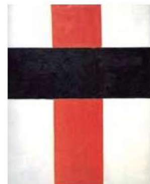
(Kazimir Malevich. Suprematismo , 1928.)