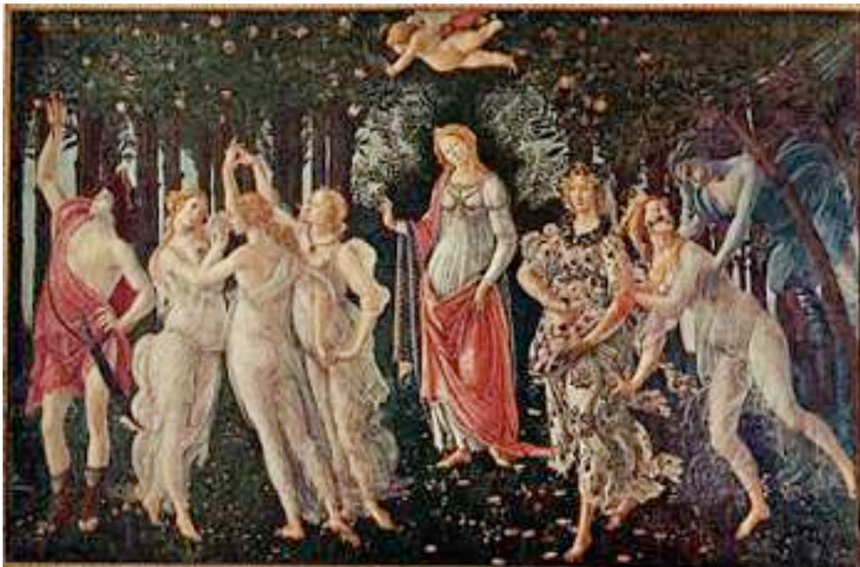
A Primavera, Sandro Botticelli, século XV.

A imagem é considerada uma das referências do movimento artístico e cultural denominado Renascimento. Analise atentamente.