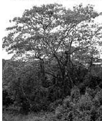
Espécie da árvore fumo-bravo

Considerando que a referida árvore foi plantada em 1º de novembro de 2009 com uma altura de 1 dm e que em 31 de outubro de 2011 sua altura era de 2,5 m e admitindo ainda que suas alturas, ao final de cada ano de plantio, nesta fase de crescimento, formem uma progressão geométrica, a razão deste crescimento, no período de dois anos, foi de