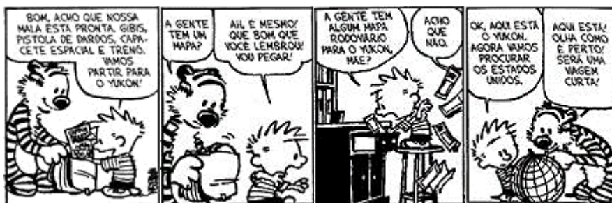
WATTERSON, Bill. Calvin e Haroldo: Yukon ho! São Paulo: Conrad, 2008

Esse erro mostra que Haroldo não sabe que o globo terrestre é elaborado com base no seguinte elemento da linguagem cartográfica: