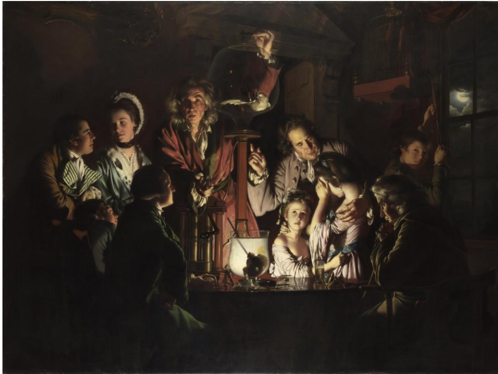
"Experimento com pássaro na bomba de ar", de Joseph Wright, 1768.