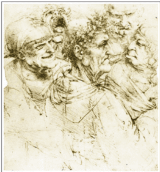
(DA VINCI, L., Cinco Cabeças Grotescas , 1490. Pena e tinta, 261 x 206 cm. Windsor, Castelo de Windsor.)

No Renascimento, arte, ciência e vida cotidiana guardam estreita relação. Nesse sentido, Leonardo da Vinci é considerado um dos mais representativos artistas deste período, uma vez que ele