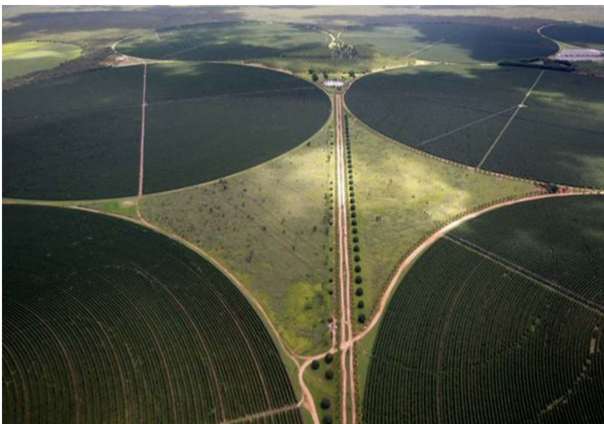
Moderna produção de grãos em Uruçuí (PI).