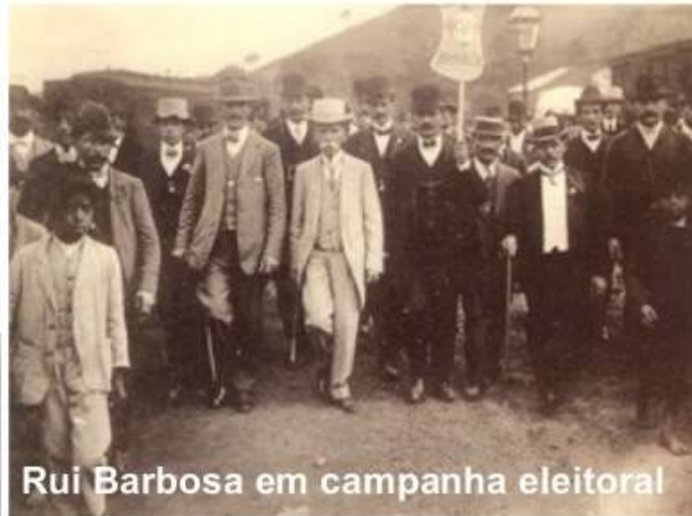
Rui Barbosa em campanha eleitoral