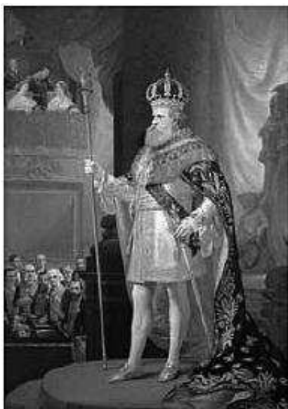
Pedro Américo, 1873