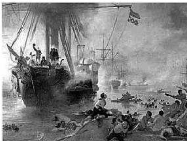
Victor Meirelles, 1872