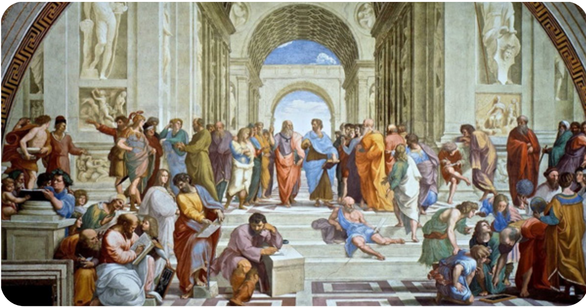
A Escola de Atenas, pintura de Rafael Sanzio.

Apesar de algumas controvérsias, tradicionalmente afirma-se que a filosofia nasceu na Grécia com as reflexões dos filósofos pré-socráticos . Trataremos deles mais adiante em outra aula. O que precisamos entender agora é o que diferencia o mito da filosofia .