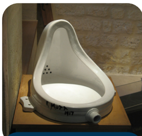
A fonte, Fontaine Duchamp

Surgido durante a Primeira Guerra Mundial, o Dadaísmo refletia a desesperança dos artistas radicados na Suíça, país que permaneceu neutro durante o conflito. Dadaísmo é a arte do nada, pois até o nome do movimento nada significa. Exagerados e irreverentes, os dadaístas eram artistas contra a arte e criavam obras que chocavam as pessoas.