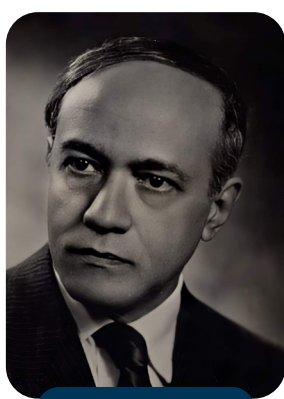
Jorge de Lima

Descrito por André Breton em três manifestos publicados entre 1924 e 1940, o Surrealismo rompia com a ordem convencional das palavras nas frases e a associação de ideias. Descendente direto do Dadaísmo, o Surrealismo unia arte e psicanálise, tendo o sonho como base para criações - e, no mundo dos sonhos, as coisas não precisam seguir regras lógicas. Na literatura, defendiam a escrita automática, em que o escritor depositava seu fluxo de pensamentos no papel, sem organizar as ideias e sem se preocupar com concordância e pontuação. Vários autores recebem influência surrealista, entre eles Jorge de Lima, que imprime um tom de sonho neste poema: