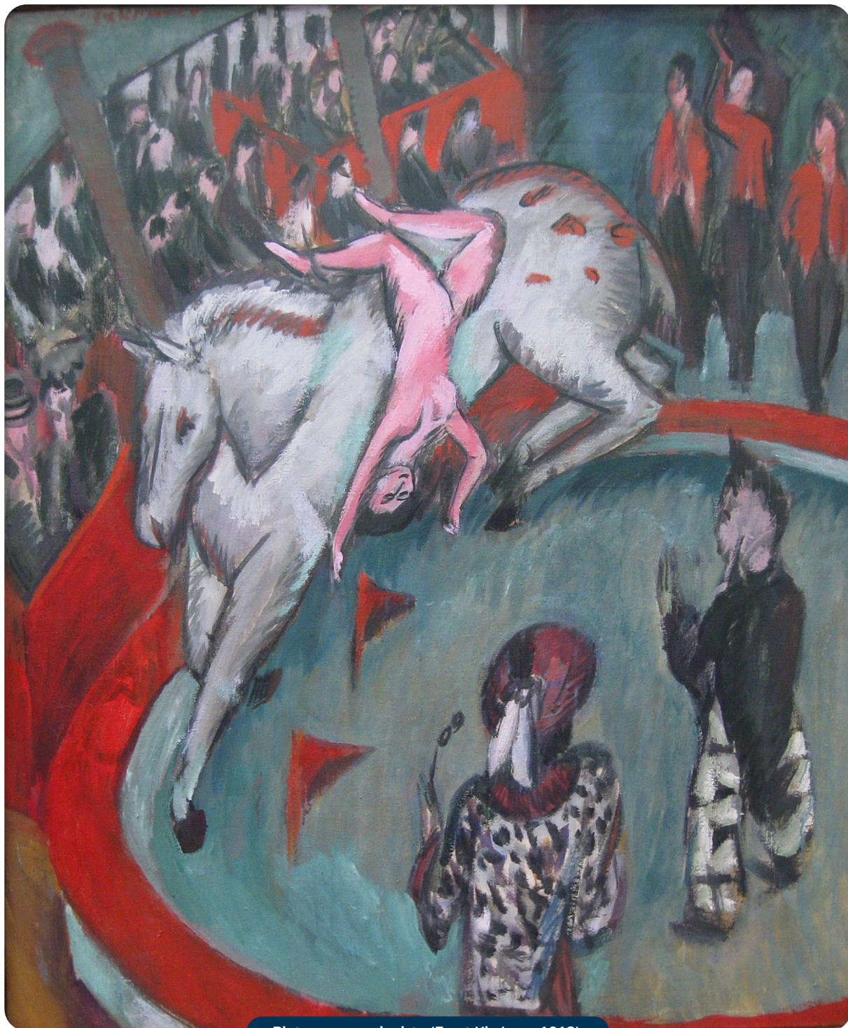
Pintura expressionista (Ernst Kirchner, 1913)

[...] Que dentro de minh'alma americana Não mais palpite o coração — esta arca, Este relógio trágico que marca Todos os atos da tragédia humana! [...]