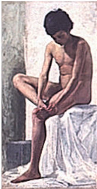
Figura 2 Detalhe da pintura a óleo sobre tela, 105 X 60 cm de Bento Barbosa Junior, Menino com espinho , Roma 1897

Apresente um esboço da sua proposta, a lápis, no papel A3 (297 x 420 mm) distribuído junto com as questões, sem se preocupar em reproduzir fielmente a figura indicada, a exatidão das dimensões ou apagar as linhas de estrutura e ordenação da imagem ( croqui ) e do texto, no formato indicado.