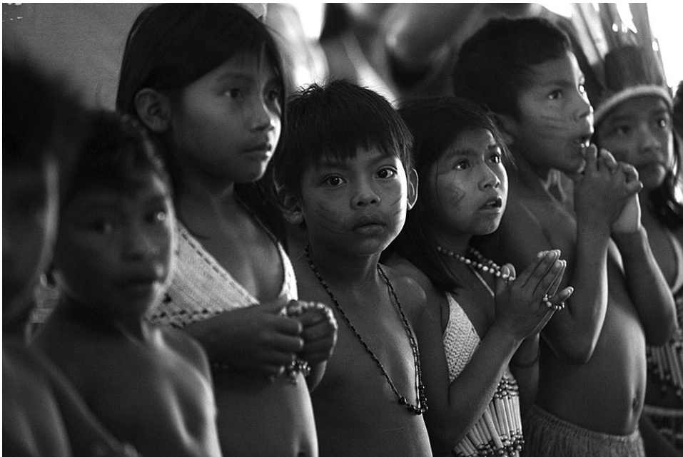
Crianças da Aldeia Raposa Serra do Sol.

CESARINO, Pedro. Histórias indígenas dos tempos antigos . São Paulo: Claro Enigma, 2015, p. 11-12. [Adaptado].