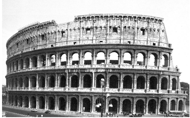
Coliseu – Roma, Itália.