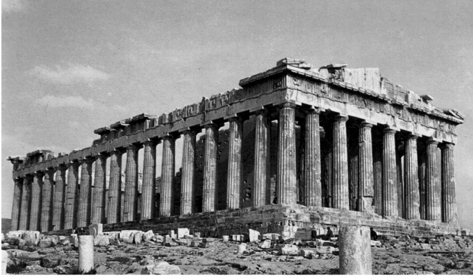
Partenon – Atenas, Grécia.