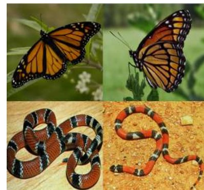
Casos de mimetismo batesiano. Em cima, borboleta monarca, impalatável (tóxica) e borboleta vice-rei, palatável. Em baixo, cobra coral-verdadeira peçonhenta, e cobra coral-falsa, não peçonhenta.

No mimetismo batesiano ou mímecria , um indivíduo inofensivo (o imitador) adquire as formas e as cores de outro mais agressivo ou venenoso, para intimidar seus predadores. A borboleta vice-rei, não venenosa, imita a borboleta monarca, venenosa, assim como a cobra coral falsa, não peçonhenta, imita a cobra coral verdadeira peçonhenta. Em ambos os casos, agressores evitam a borboleta vice-rei e a cobra coral-falsa com receio de se confundirem com as espécies mais perigosas. Alguns autores reservam o nome mímecria só para esse caso.