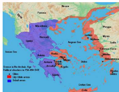
Mapa da Grécia antiga no Período Arcaico