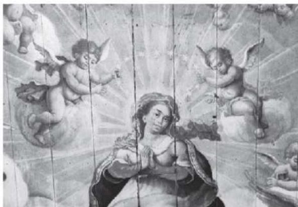
ATAÍDE, M. C. Coroação de Nossa Senhora de Perpetua . Detalhe da pintura do forro da nave da Igreja de São Francisco de Assis de Ouro Preto. 1801-12.

Disponível em: http://enciclopedia.itaucultural.org.br . Acesso em: 30 out. 2015.