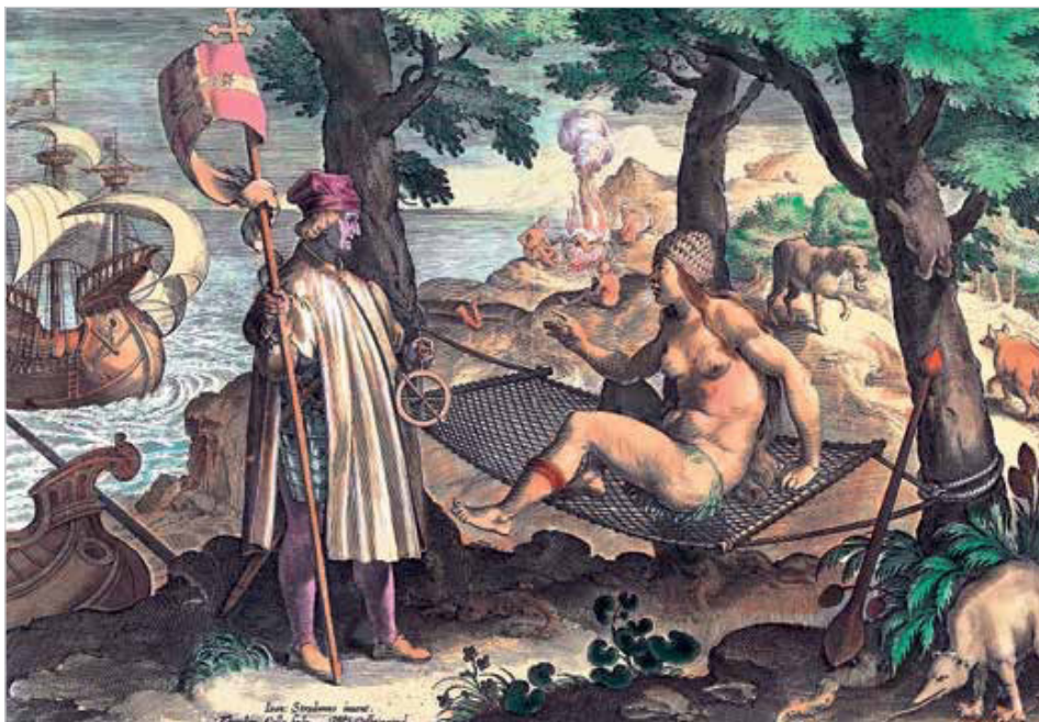
Vespúcio descobre a América. Gravura de Theodor Galle e Jan van der Straet, 1598.

B Aponte dois desdobramentos dessa visão em relação às práticas empreendidas pelos europeus no Novo Mundo.