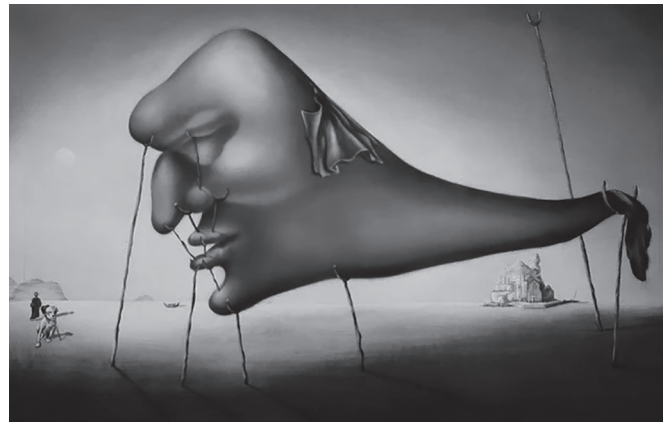
DALÍ, Salvador. O sono . 1937.

Comparando-se os textos I e II, percebe-se que eles compartilham de uma ideia da figura humana como uma