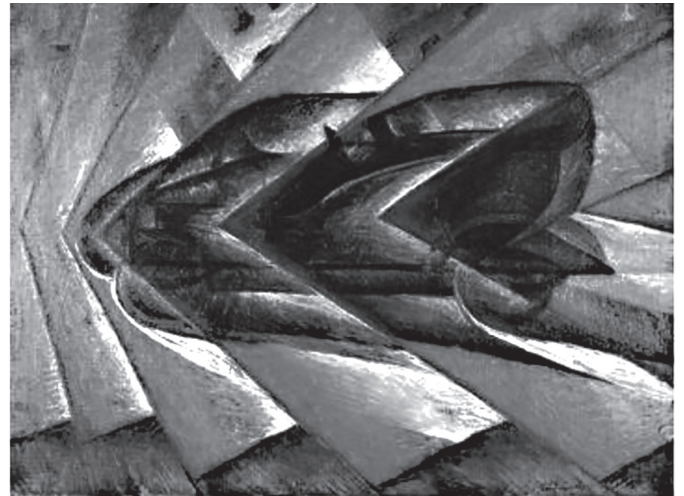
RUSSOLO, L. O Dinamismo de um Automóvel . Acervo do Museu Nacional de Arte Moderna de Paris, 1913.

A produção artística do italiano Luigi Russolo integra o conjunto de obras que caracterizaram os movimentos de vanguarda do século XX. Um traço do Futurismo presente na obra de Russolo é a