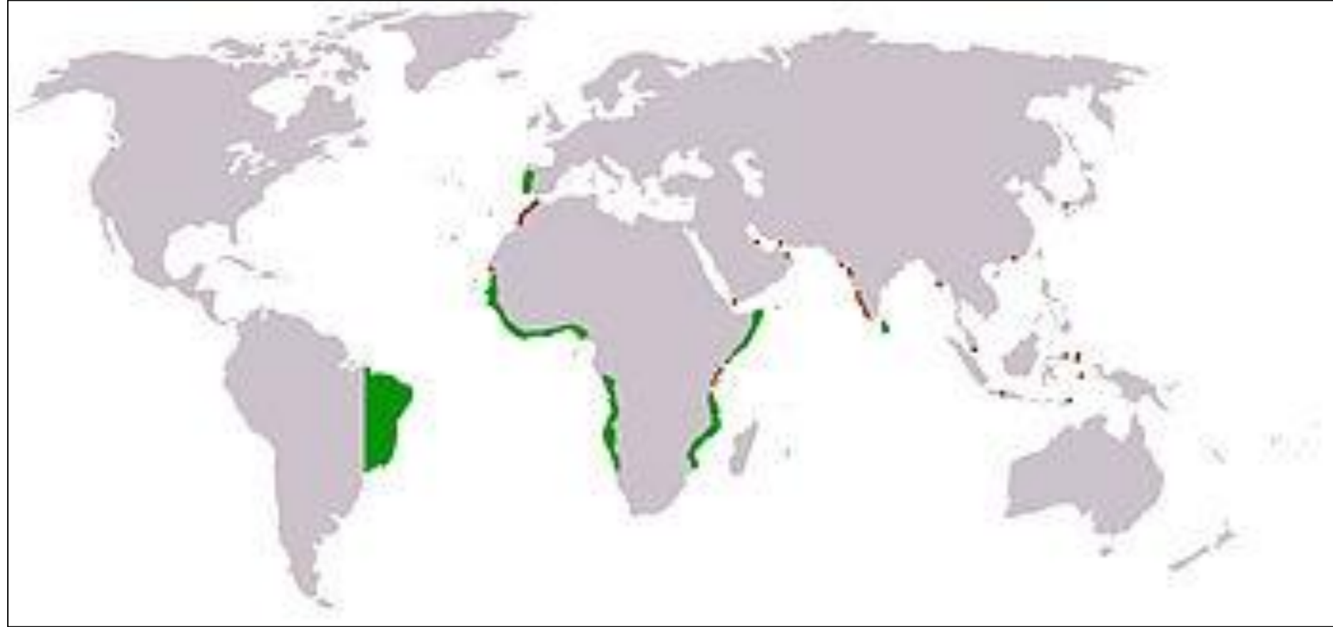
Império Português durante o reinado de D. João III (1521-1557)