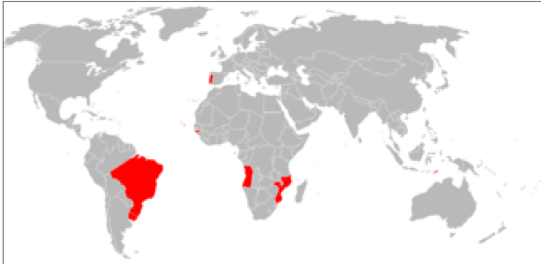
Extensão máxima do Império Português no século XVII