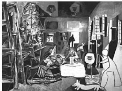
PICASSO, Pablo. Las Meninas , 1957. Museu Picasso, Barcelona.