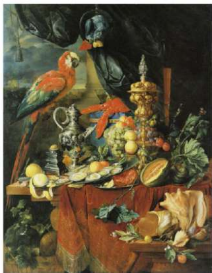
(Jan Davidsz de Heem. Natureza Morta com Papagaios . The Ringling Museum, fim da década de 1640.)

2. (UNICAMP) As imagens produzidas por artistas europeus, tal como vemos na pintura do holandês Jan Davidsz de Heem, tiveram um papel importante na construção do conceito de exótico no imaginário da Europa na época moderna.