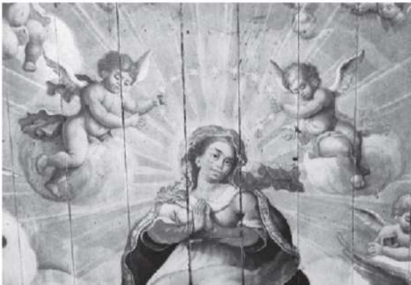
ATAÍDE, M. C. Coroação de Nossa Senhora de Porciúncula. Detalhe da pintura do forro da nave da Igreja de São Francisco de Assis de Ouro Preto. 1801-12.

Disponível em: http://enciclopedia.itaucultural.org.br . Acesso em: 30 out. 2015.