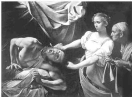
CARAVAGGIO, M. M. Judite e Holoferne . Óleo sobre tela, 144 x 195 cm. Galeria Nacional de Arte Antiga, Roma, 1958.

Disponível em: www.wga.hu . Acesso em: 31 jul. 2012.