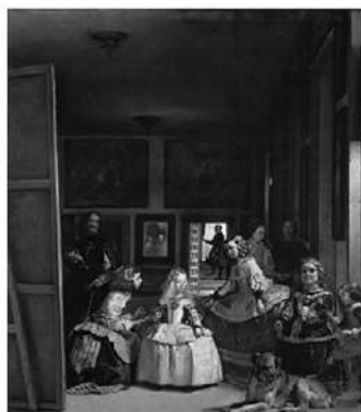
VELÁZQUEZ, Diego. Las Meninas , 1656. Museu do Prado, Madrid.

Os quadros tratam do mesmo tema, embora pertençam a dois momentos distintos da história da arte. O confronto entre as imagens revela um traço fundamental da pintura moderna, que se caracteriza pela