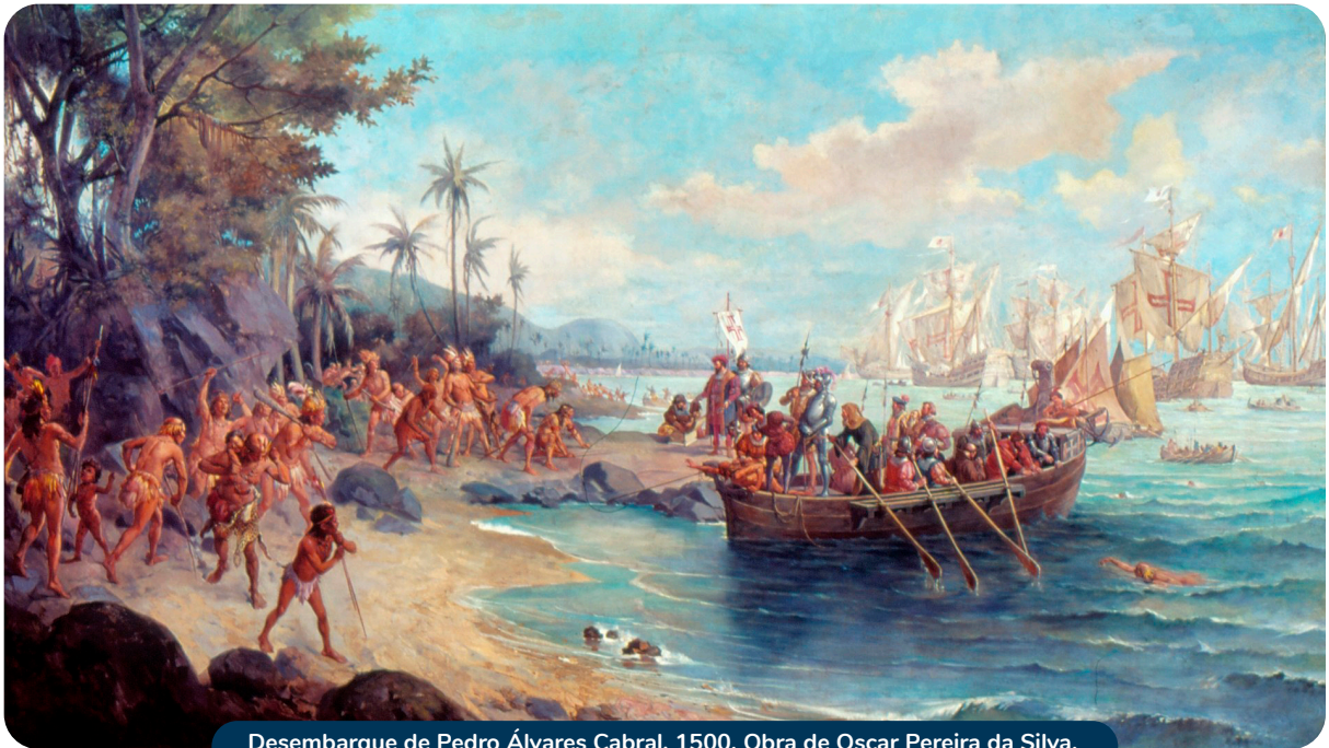
Desembarque de Pedro Álvares Cabral, 1500. Obra de Oscar Pereira da Silva.