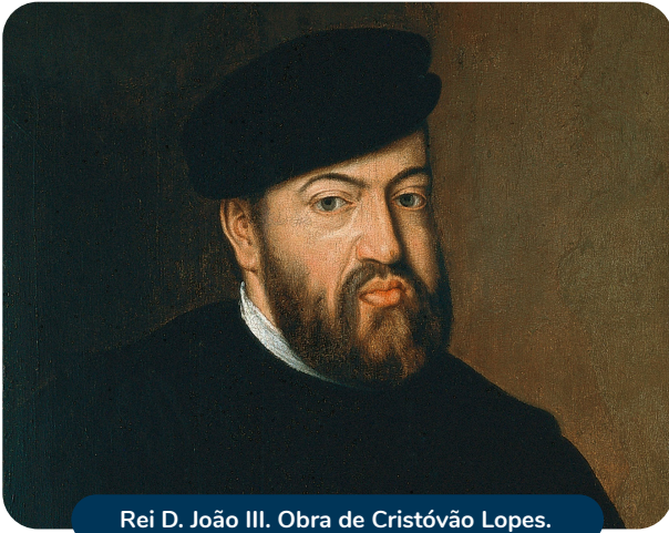
Rei D. João III. Obra de Cristóvão Lopes.

Sendo assim, o rei de Portugal, D. João III (1521-1557), enviou para o Brasil uma expedição colonizadora que foi comandada por Martim Afonso de Sousa, cuja missão além de colonizar o território, era descobrir a existência de metais preciosos e combater os franceses. No ano de 1532, Martim Afonso de Sousa fundou a Vila de São Vicente , no litoral do atual estado de São Paulo, que foi o primeiro núcleo de povoamento da colônia.