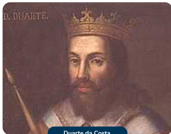
Duarte da Costa

O governo de Duarte da Costa ficou marcado pelo combate que moveu contra os franceses que haviam fundado uma colônia na Baía de Guanabara em 1555, a que chamaram de França Antártica . Além disso, ele trouxe mais colonos e mais padres jesuítas, entre eles, Manoel da Nóbrega e José de Anchieta , que muito contribuíram para a educação no Brasil, vindo a fundar um colégio no ano de 1554 que veio dar origem à cidade de São Paulo .