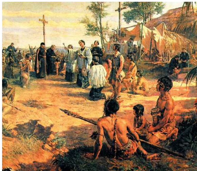
1549 – Companhia de Jesus