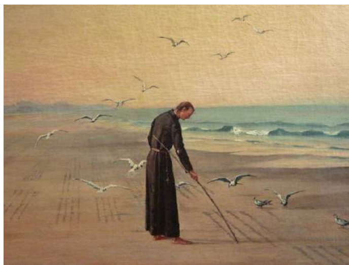
1553 – Padre José de Anchieta