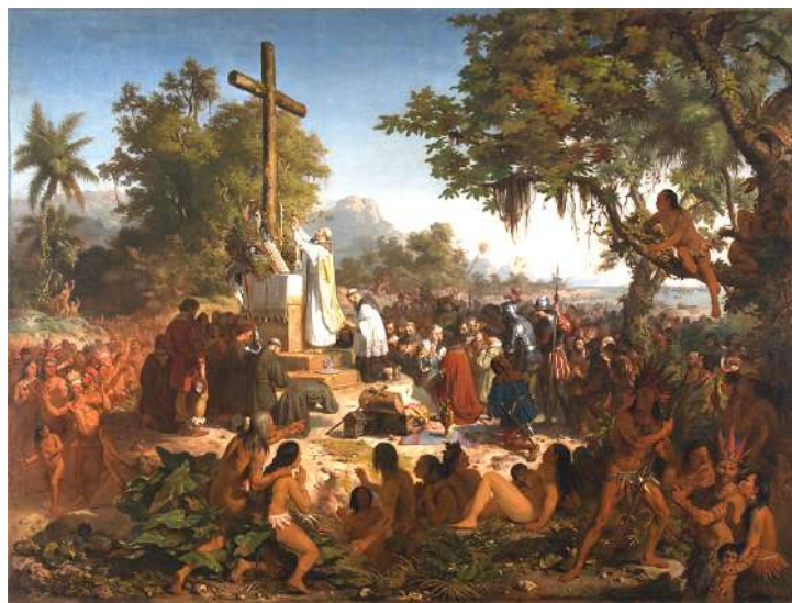
Victor Meirelles. Primeira missa no Brasil (1860)