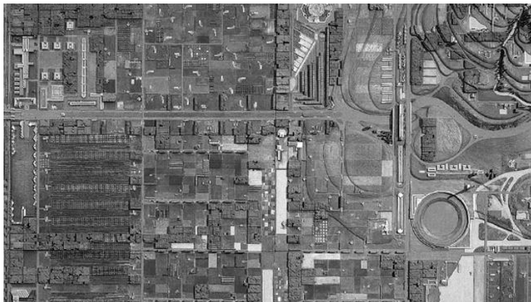
Projeto Metr polis Broadacre. http://www.metropolismag.com/wp-content/uploads/data-import/a2/a254fdfe222873ab9b7be2aafcecef589-broadacre1.jpg

A partir do texto sobre Frank Lloyd Wright, podemos constatar sua longa produção e contribuição, atentamos para sua criatividade e visão futurista. De início vemos que ele criou o símbolo do futuro, que seria a “casa americana”, mais especificamente definiria o estilo de vida americana a partir de suas arquiteturas e todos os componentes existentes nela. Isso o levaria além, a criação da “cidade ideal”, a metrópole Broadacre City. Ao mesmo tempo, Wright buscava uma integração nos interiores, no qual buscava criar um diálogo entre os espaços, os objetos e as vestimentas desse indivíduo, e se valendo de toda a tecnologia possível para realizar seus projetos. Pensando no futuro próximo, 2025, no qual o indivíduo está inserido em uma “Broadacre City”, que foi idealizada por muitos, desenvolva um projeto-conceito por meio de desenho que esteja em consonância entre lugar, indivíduo e estilo de vida futurista na cidade de São Paulo.