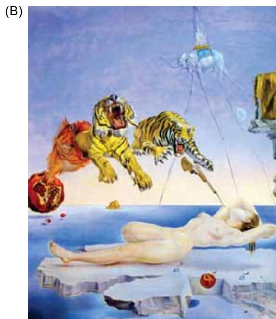
(Salvador Dalí. Sonho causado pelo voo de uma abelha ao redor de uma romã um segundo antes de acordar .)