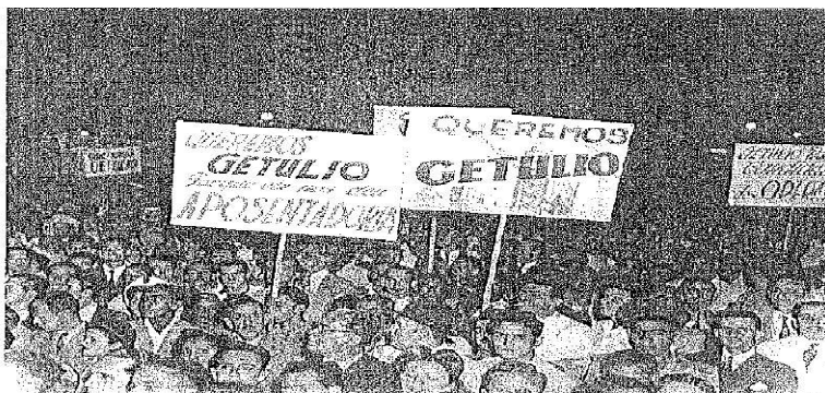
Comício queremista no Largo da Carioca, 1945. Rio de Janeiro, CPDOC.

O Queremismo foi um movimento surgido em maio de 1945 que visava defender a continuidade do presidente Getúlio Vargas no poder. Sendo assim, é correto afirmar que o Queremismo resultou