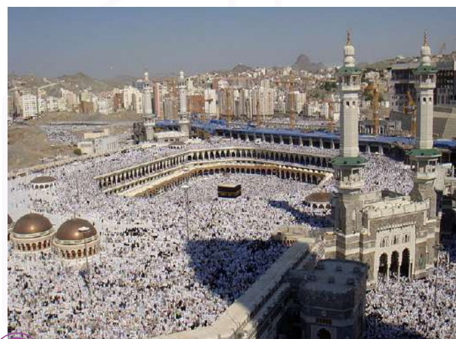
A Grande Mesquita de Meca (Masjid al-Haram) com a Caaba ao centro - fonte: Al-Jazeera English.