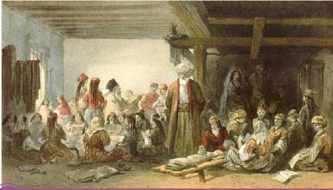
Estudantes Islâmicos - Carlo Bossoli (1856).

suficiente, vestes e abrigo e isso o instiga a preencher as necessidades desses irmãos, procurar saber sobre seu bem estar e cuidar de suas necessidades”.