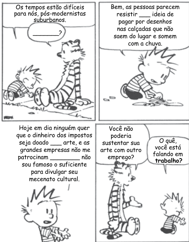
(Bill Watterson. O mundo é mágico: as aventuras de Calvin & Harold , 2007. Adaptado.)

Assinale a alternativa que preenche, correta e respectivamente, as lacunas da tira.