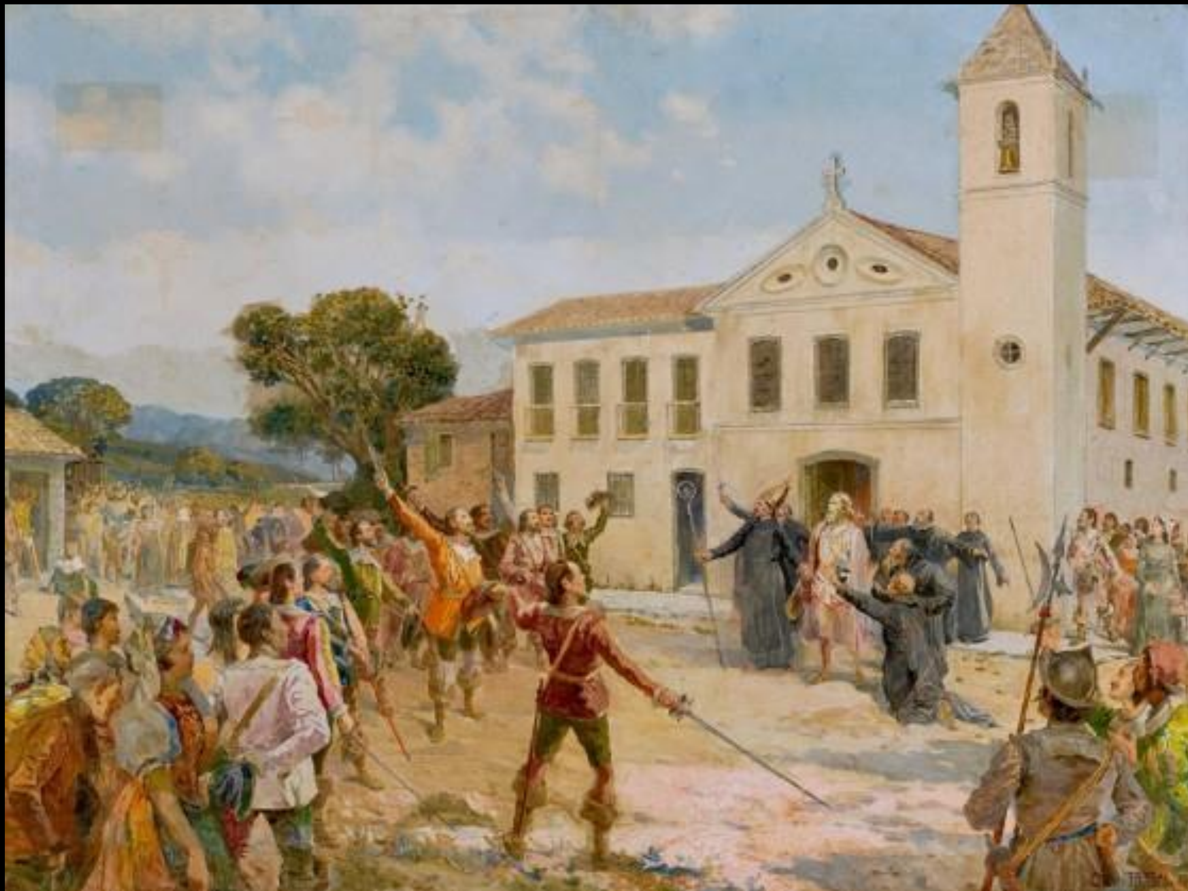
Aclamação de Amador Bueno, 1909 Óleo de Oscar Pereira da Silva