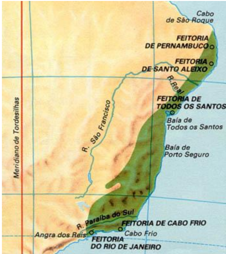
A costa do pau-brasil

Foram criados FEITORIAS onde era mais abundante o pau-brasil, para armazená-la e protegê-la dos ataques contrabandistas franceses e tribos hostis.