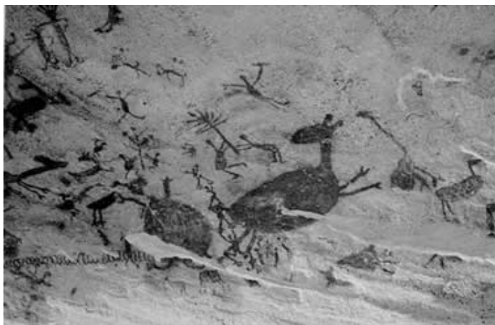
Pintura rupestre da Toca do Pajaú – PI. Internet: www.betocelli.com .

A pintura rupestre acima, que é um patrimônio cultural brasileiro, expressa