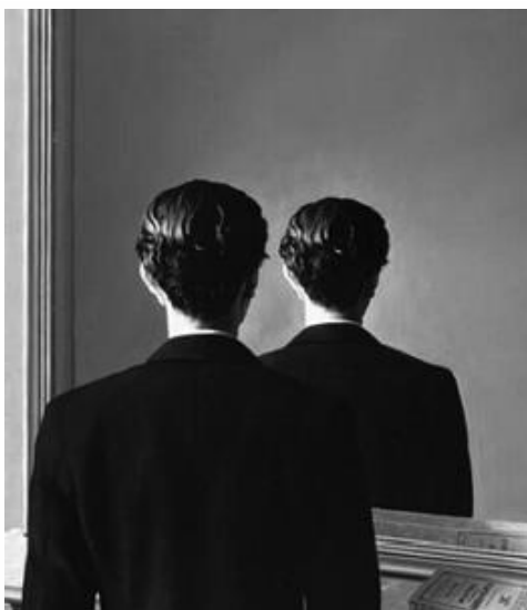
MAGRITTE, R. A reprodução proibida . Óleo sobre tela, 81,3 x 65 cm. Museum Boijmans Van Buningen, Holanda, 1937.