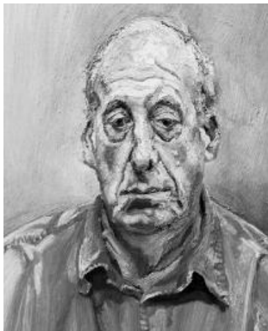
FREUD, L. Francis Wyndham . Óleo sobre tela, 64 x 52 cm. Coleção pessoal, 1993.