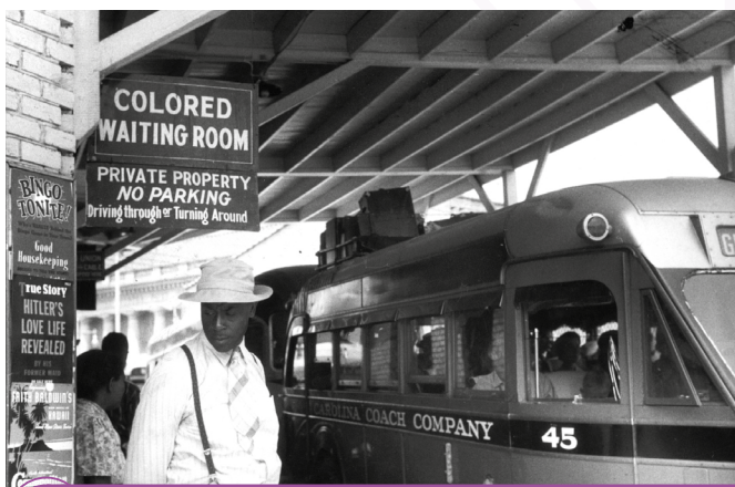
Marcas do segregacionismo em rodoviária na Carolina do Norte.